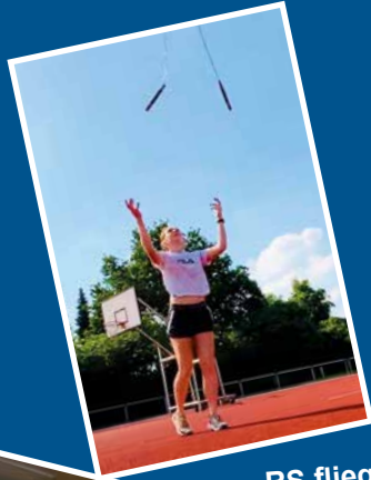
RS fliegendes Seil