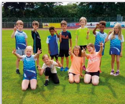
Unsere jüngsten mit viel Freude und starken Leistungen beim KiLa-Cup