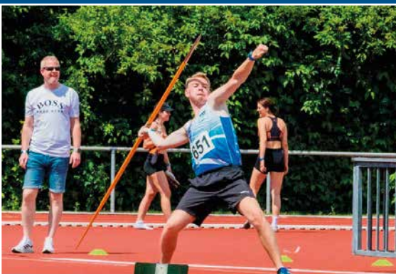
Weitere Eindrücke von den Kreismeisterschaften: