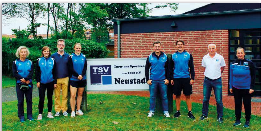
Der neue Vorstand der Leichtathletikabteilung