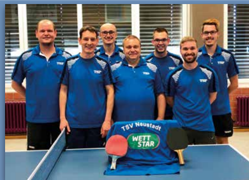
1. Herren Aushängeschild der Tischtennissparte

Während der Nachwuchs im 2. Kreis unterwegs ist, starten die „Großen“ im 4., 3. und 1. Kreis, dem 2. und 1. Bezirk und erneut mit der „Ersten“ in der Bezirksoberliga.