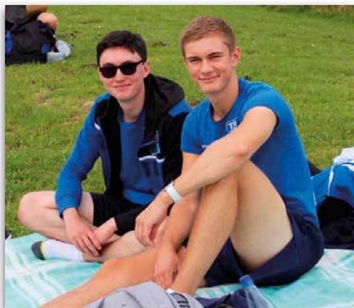
Gute Laune beim Sparkassen-Meeting in Sarstedt