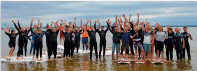
TopTen-Schwimmer aus dem Kreis zu Gast im Neustädter Land: Beim alternativen Wassersport am Steinhuder Meer hatten sie viel Spaß.

Teilgenommen haben 39 Schwimmer aus 13 Vereinen. Die Sportler hatten - insbesondere mit dem großen Stand Up Paddling Board für zehn Personen - viel Spaß.