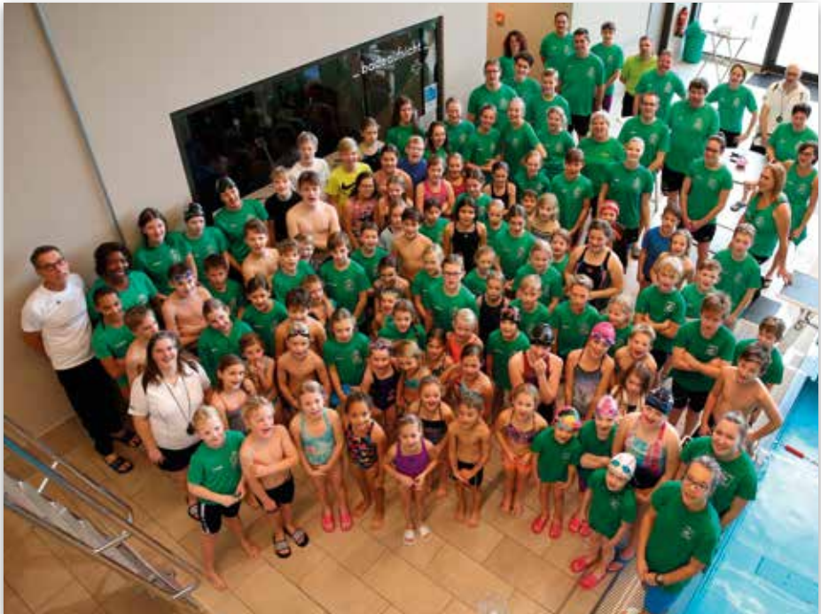
Mehr als 100 Teilnehmer waren wieder bei der Vereinsmeisterschaft am Start, zum ersten Mal im Balneon.

Pünktlich um 9 Uhr hatten sich alle Teilnehmer aus dem TSV und dem SSG-Partnerverein TuS Seelze eingefunden, so dass die Meisterschaft planmäßig beginnen konnte. Mehr als 100 Kinder, jugendliche und erwachsene Schwimmerinnen und Schwimmer der SSG Nord Calenberg waren dabei, um sich auf verschiedenen Distanzen und in verschiedenen Lagen zu