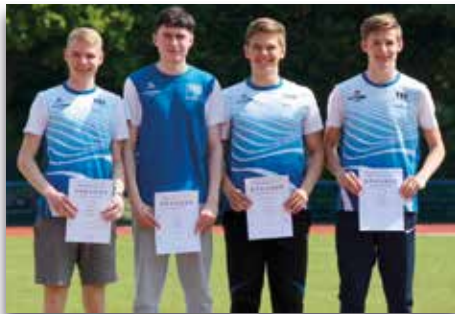
Starke 4x100m Staffel der mJU20