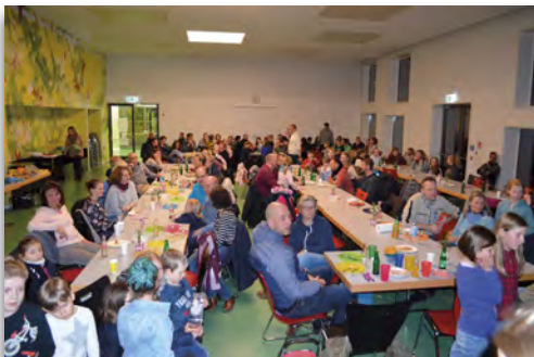
Die Mensa der Leine-Schule war beim Neujahrsfest der Schwimmabteilung bestens gefüllt.