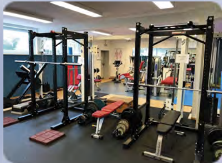
Neugestalteter Krafraum Seite 54