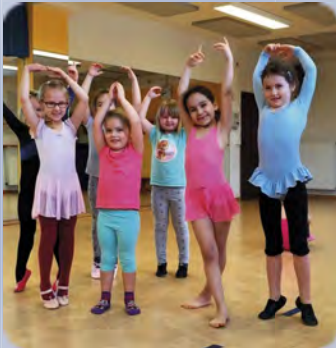
Ballett vereint mit Bodenturnen Seite 46